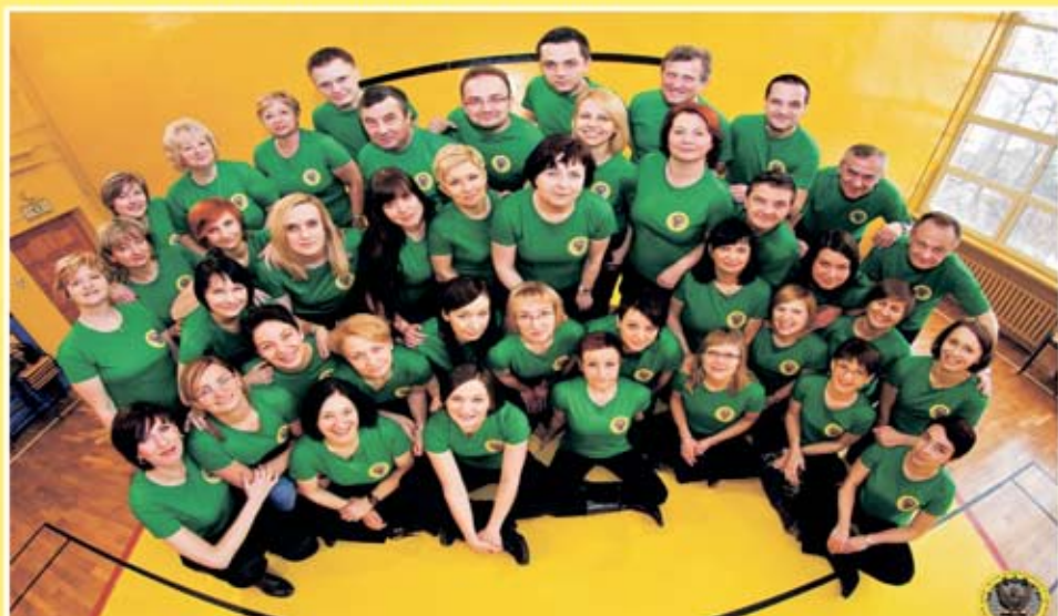
ZESPÓŁ SZKÓŁ NR 4 IM. KOMISJI EDUKACYJNEJ W OLSZU Grono Pedagogiczne 2012/2013

Warto dodać, że wnioski o udział w projekcie złożyły 733 polskie szkoły, a tylko 252 uzyskały akceptację. Wniosek olkuskiej "Budowlanki" dostał 38 punktów na 40 możliwych. Przed Zespołem Szkół Nr 4 sporo wyzwań organizacyjnych i nowych doświadczeń na miarę szkoły XXI wieku.