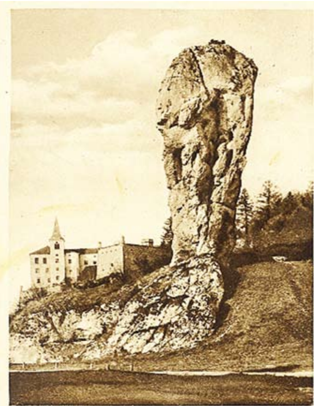
PIESKOWA SKAŁA. Sokolico