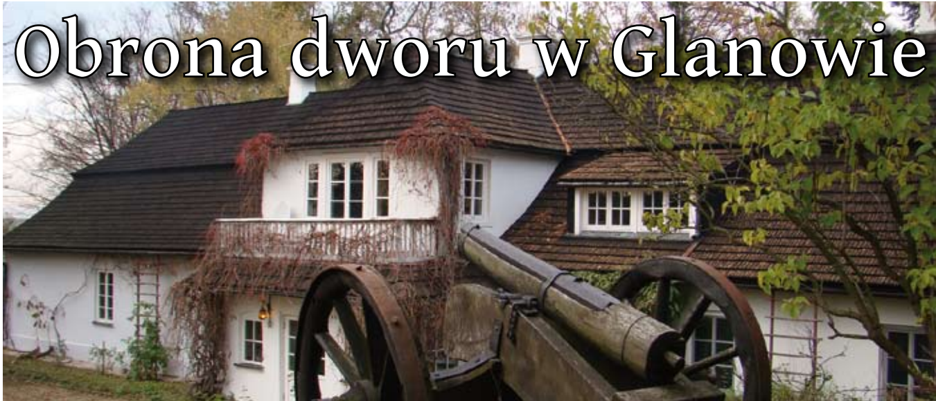
Dwór w Glanowie