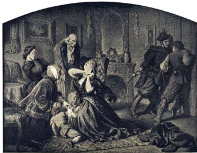
Reprodukcja rysunku „Obrona dworu” Artura Grottera.

Uwaga, dwór jest prywatny i nie można go zwiedzać.