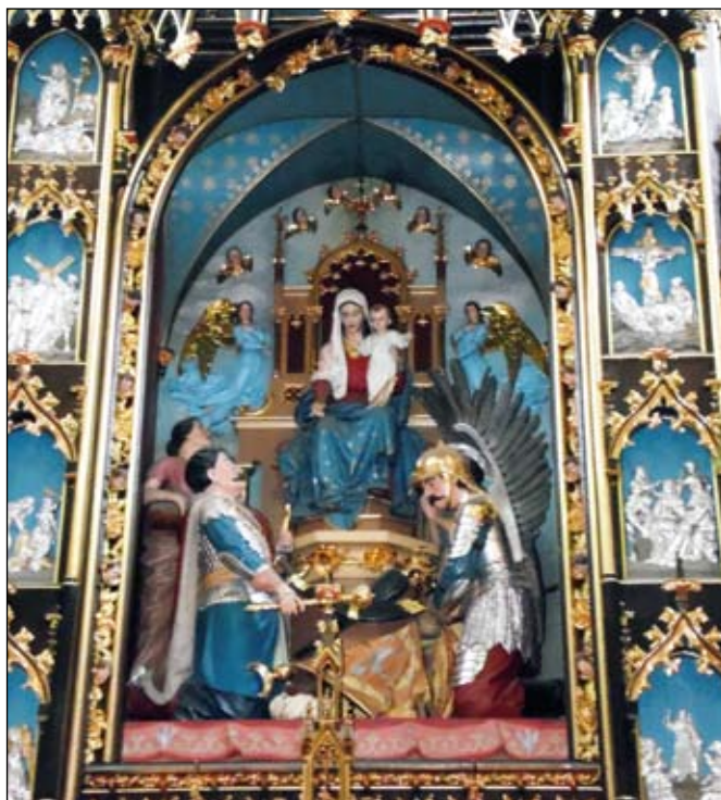
Ołtarz główny, fot. autor.