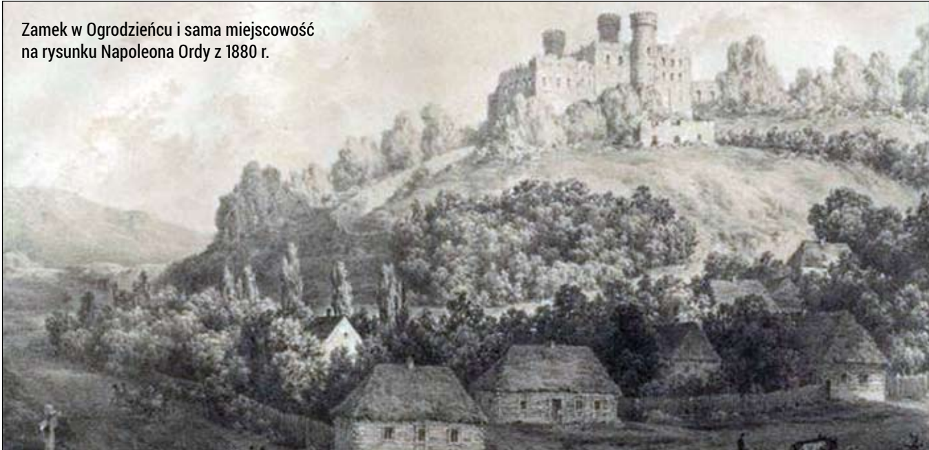
Zamek w Ogródzieńcu i sama miejscowość na rysunku Napoleona Ordy z 1880 r.

sympatyka antytrinitaryzmu (nurt nieuznający Trójcy Świętej, uważający, że Bóg jest w jednej osobie), a zwłaszcza gdy nie udało mu się zażegnać rozłamu w kalwinizmie (m. in. dysputa w Balicach), zerwał ze swym dawnym „pupilem”. Zwalczal też dyteistów.