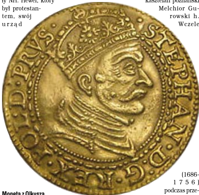
Moneta z Olkusza, 1580 r., z portretem króla Stefana Batorego.

Co ciekawe jeszcze w 1738 r. kasztelan poznański Melchior Gurowski h. Wczele