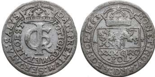
Tymf (złotówka) z czasów Jana Kazimierza, 1663 r.