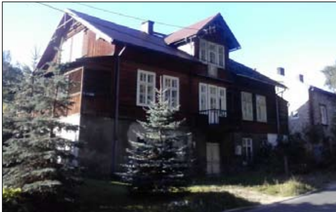
Stara drewniana willa przy ul. Parkowej.