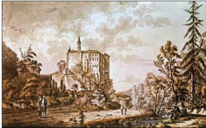
Zygmunt Vogel, zamek Pieskowa Skala i Prądnik, 1787 r.

właścicieli dóbr, Potockich. W okolicy znajdowało się jeszcze wiele zamków i klasztorów, z których można było czerpać gruz i tynki. Wydajność fabryk przewidywano na 2000 funtów saletry tygodniowo. W rzeczywistości była ona znacznie mniejsza. Brak było rąk do pracy i podwół do zwózki surowca”. Fabryki w Ojcowie czynne były jeszcze we wrześniu 1931 r. W marcu 1832 r. zostały opieczętowane, a w 11 lat później ostatecznie zlikwidowane i zrujnowane. Ocenia się, że podczas Powstania Listopadowego wyprodukowano 200 tys. funtów prochu. Z tego prawie 87 tys. funtów dały prochuwnie w prądnickie (43 proc.). Z tej ilości można było wytworzyć 3 281 934 naboje karabinowe. Kim był ów energiczny kapitan