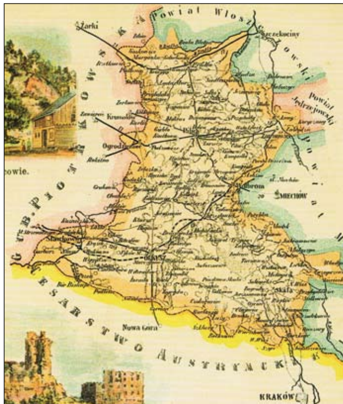
Powiat Olkusz w latach 1866-1914.

powiat olkuski (Gubernia Kielecka) był niezwykle rozległy. Od zachodu graniczył z powiatem będzińskim, od północy z włoszczowskim, od wschodu z jędrzejowskim i miechowskim, a od południa z Galicją. Liczył 2554 mil kwadratowych (ok. 1105 km 2 ). W jego skład obok Olkusza wchodziły następujące gminy wiejskie: Bolesław, Cianowice, Jangrot, Kidów, Kroczyce, Kromolów (do 1886 r.), Minoga, Ogrodzieniec, Pilica, Rabsztyn, Sławków, Sułoszowa, Wolbrom, Żarnowiec. W gminach tych mieściło się 6 osad miejskich czyli dawnych