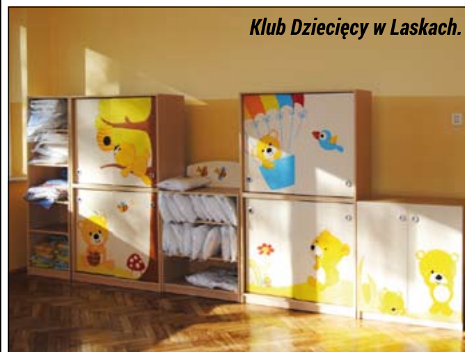
Klub Dziecięcy w Laskach.

Zasady naboru są takie same jak w Laskach. Stawka za godzinę pobytu dziecka w Klubie będzie wynosiła 1,60 zł. Rodzice zainteresowani zapisaniem dziecka do „Leśnych Skrzatów” uzyskają wszelkie informacje w tamtejszym przedszkolu.