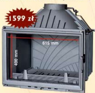
Wkład Vision 700 z dolotem powietrza - 14 kW