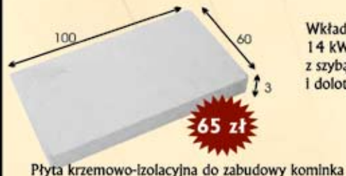
Płyta krzemowo-izolacyjna do zabudowy kominka

F.H.U. KRYN-KOM Olkusz, ul. Składowa 1, tel. 502 951 338