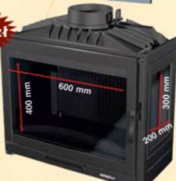
Wkład kominkowy 14 kW z szybą boczną i dolotem powietrza