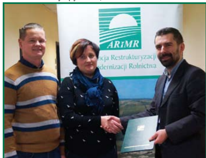
Podpisanie umowy z beneficjentem działania „Modernizacja gospodarstw rolnych”