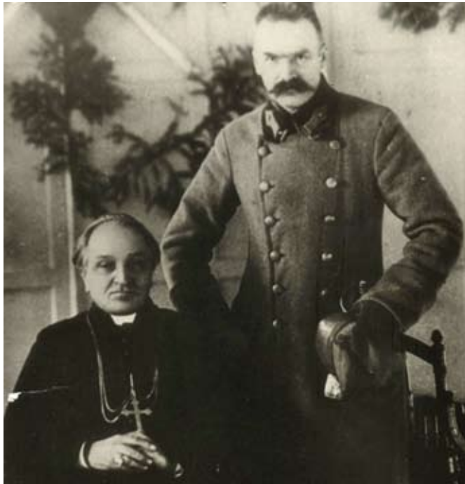
J. Piłsudski i kapelan I Brygady Legionów ks. bp dr Władysław Bandurski.