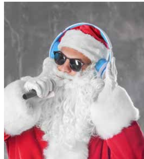
Autor: Departament Kultury i Dziedzictwa Narodowego, pełny tekst na: www.malopolska.pl/aktualnosci/kultura/kulturalna-malopolska-na-mikolajkowy-weekend

Spektakl można obejrzeć w piątek 3 grudnia i niedzielę 5 grudnia o godz. 18.30.