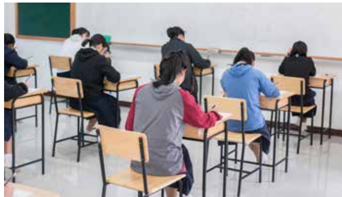
OGŁOSZENIE URZĘDU MIASTA I GMINY W OLKUSZU

Centralna Komisja Egzaminacyjna poinformowała we wtorek, że podczas tegorocznej matury do egzaminów w wszystkich przedmiotach obowiązkowych przystąpiło 268 257 tegorocznych absolwentów liceów ogólnokształcących, techników oraz branżowych szkół II stopnia. Pozytywny wynik uzyskało 78,2 proc. maturzystów. Osoby, które nie zdały tylko jednego z przedmiotów obowiązkowych, będą mogły przystąpić do egzaminu poprawkowego 23 sierpnia. Tę grupę stanowi 15,5 proc. zdających. Pozostali uczniowie będą mogli