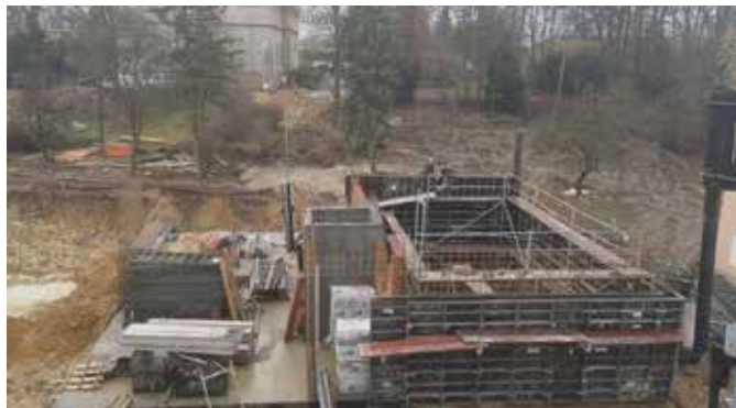
Budowa budynku na potrzeby Biblioteki i Ośrodka Animacji Kultury w Trzyciążu