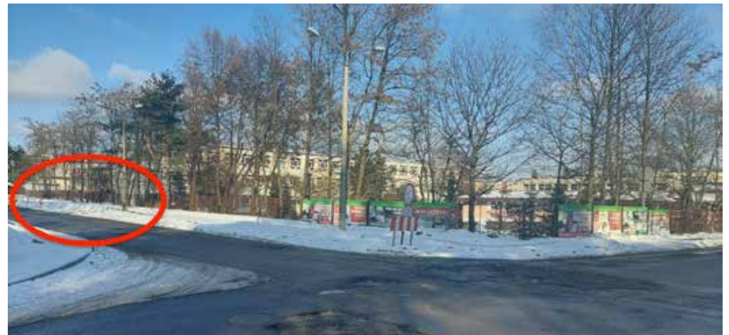
fot. 2 Miejsce, w które ma zostać przeniesiony dotychczasowy przystanek „Olkusz Kościół” (od strony Budowlanki)

Po wybudowaniu nowej zatoki autobusowej, przeciwległy przystanek „Olkusz Kościół” (od strony „Budowlanki”) nie mógł jednak dłużej stać w obecnym miejscu i to z aż dwóch powodów. Po pierwsze, jak sam wskazał powiatowy Zarząd Drogowy, zgodnie z przepisami dwie zatoki autobusowe nie mogą znajdować się naprzeciwko siebie. Po drugie, w okresie projektowania przebudowy tego powiatowego traktu obowiązywał przepis, który stanowił, że zatoki autobusowe należy usytuować za skrzyżowaniem, a nie przed nim. Skoro podległy starostwu Zarząd Drogowy tak umiłował sobie przesuwanie przystanków autobusowych o kilkadziesiąt metrów, to akurat w tym przypadku miał pełne pole do popisu: mógł przykładowo - co miałyby najwięcej sensu - przesunąć przystanek „Olkusz Kościół” (od strony „Budowlanki”)