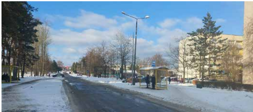
fot. 1 Po lewej przesunięty o kilkadziesiąt metrów przystanek „Olkusz Kościół” (od strony Parafii), a po prawej przystanek „Olkusz Kościół” (od strony Budowlanki), który wkrótce zostanie zlikwidowany

Przy okazji remontu znajdującej się w ciągu drogi powiatowej 1077K ulicy Biema w Olkuszu, podległy starostwu Zarząd Drogowy postanowił przesunąć przystanek autobusowy „Olkusz Kościół” (od strony Parafii) kilkadziesiąt metrów bliżej skrzyżowania z ulicami Legionów Polskich i Jana Pawła II. Nie śmiem wątpić, że z urzędniczego punktu widzenia budowanie nowej zatoki autobusowej zaraz obok dotychczasowej było bez wątpienia niezwykle potrzebne, jednak teraz może dojść do całkowitego sparaliżowania komunikacji miejskiej w tej części miasta. Zgodnie z przepisami, przeciwległy przystanek „Olkusz Kościół” (od strony „Budowlanki”) nie może bowiem znajdować się w obecnym miejscu, a kolejna błyskotliwa decyzja powiatowego Zarządu Drogowego w sprawie jego nowej lokalizacji sprawi, że mieszkańcy zostaną pozbawieni dostępu do najpopularniejszej w mieście linii „M”.