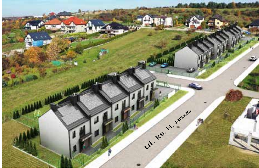
fot. Wizualizacja osiedla domów przy ul. Januchty, którego budowa rozpocznie się jeszcze w tym roku

Apeluję: rozmawiamy o środkach publicznych, tu nie ma miejsca na politykę.