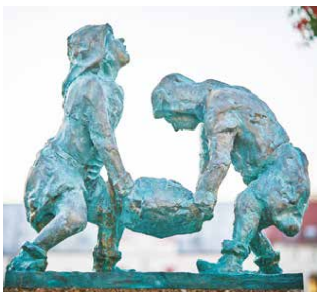
Gwarki olkuskie

Chodzi o tworzenie innowacyjnych pracowni, otwartych laboratoriów, dzięki którym mieszkańcy zyskają dostęp do różnorodnych maszyn i urządzeń, nowoczesnych technologii oraz wiedzy i know-how, gdzie będą wspierani w nabywaniu umiejętności związanych z branżami zielonymi oraz dobrymi praktykami klimatycznymi.