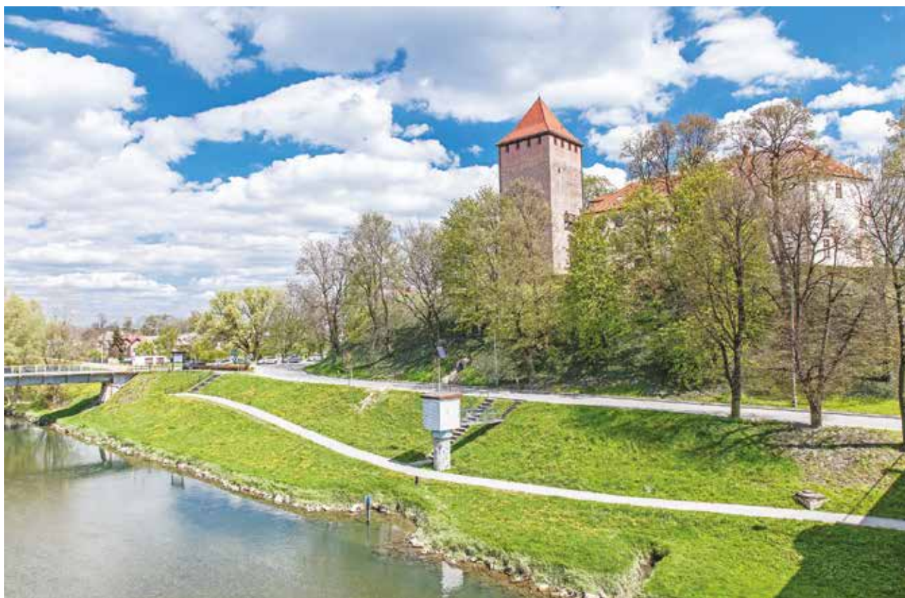
Oświęcim, archiwum UMWM

Fundusz na rzecz Sprawiedliwej Transformacji (FST) w programie Fundusze Europejskie dla Małopolski, to jedno z narzędzi Europejskiego Zielonego Ładu, czyli działań na rzecz zrównoważonej gospodarki. Jest przeznaczony dla regionów, które funkcjonują w oparciu o wydobywanie węgla, a tym samym są narażone na negatywne skutki społeczne odchodzenia od tego surowca. W Małopolsce to przede wszystkim cztery powiaty: olkuski, oświęcimski, chrzanowski i wadowicki.