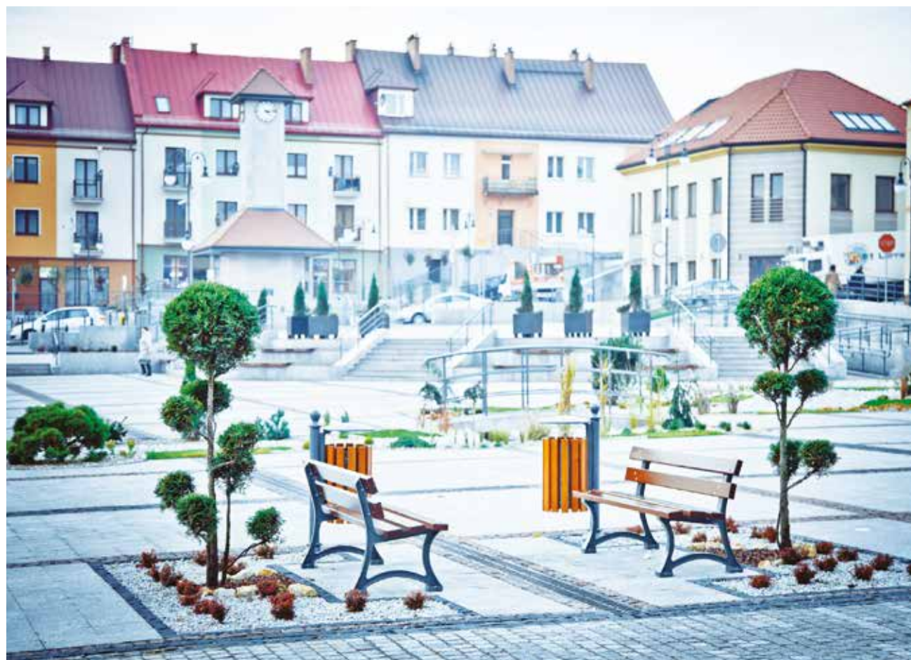
Trzebinia, fot. J. Leśniewski

Natomiast pula 41,1 mln zł skierowana została na rozwój niebiesko-zielonej infrastruktury. Fundusze Europejskie pomogą sfinansować wprowadzanie rozwiązań opartych na przyrodzie („nature-based solutions”), wspierających łagodzenie zmian klimatu, redukcję emisji gazów cieplarnianych, wpływających na zachowanie różnorodności biologicznej, takich jak np.: parki kieszonkowe, stawy retencyjne, zielone dachy, ogrody deszczowe, zielone przystanki, „odbetonowanie”, rozumiane jako usuwanie powierzchniowych uszczelnień gruntu, w wyniku czego powstaną tereny zagospodarowane zielenią czy niebieską infrastrukturą. Dotacja może pokryć nawet 95% kosztów.