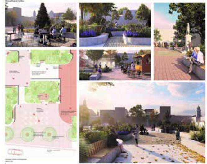
zdj. Wizualizacja pochodziąca z koncepcji rewitalizacji centrum Wolbromia, która wygrała gminny konkurs na to zadanie. Władze gminy zapłaciły za nią ze środków publicznych 20 tys. zł, niestety pojawiły się wątpliwości, czy koncepcja jest zgodna z zaleceniami konserwatorskimi....

Rządowy Program Odbudowy Zabytków kierowany jest bezpośrednio do jednostek samorządu terytorialnego, a za ich pośrednictwem również do innych podmiotów zobowiązanych do opieki nad zabytkami. Stąd też wśród zabytków, które będą restaurowane znajdują się nie tylko obiekty należące bezpośrednio do samorządów, ale także do leżących na terenie gmin parafii oraz będące własnością prywatną.