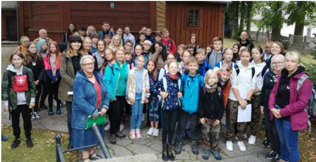
fot. Uczestnicy w punkcie startowym pod kościołem w Porębie Dzierżnej