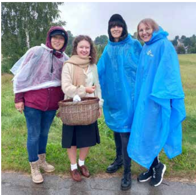
fot. Uczestniczkę rajdu wspólnie z rekonstruktorzką