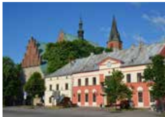
zdj. „Dom pod zegarem” w Rynku olkuskim

Pozytywnie oceniony wniosek na kwotę 500 000 zł złożył również samorząd powiatu olkuskiego , który zamierza realizować zadanie pn. „Polepszenie parametrów przeciwpożarowych zabytkowego budynku Zespołu Szkół nr 1 im. Stanisława Staszica w Olkuszu - etap II”.