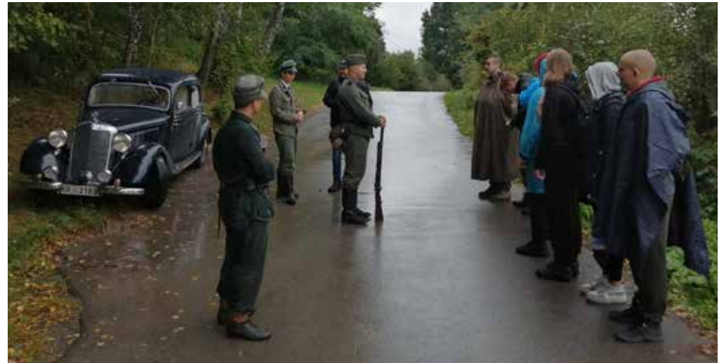
fot. Uczestnicy rajdu w punkcie zadaniowym