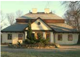
zdj. Zabytkowy dworek w Krzykawce

Z puli drugiej edycji Rządowego Programu Odbudowy Zabytków środki otrzyma Gmina Bolesław, która zaplanowała dwa zadania: Konserwację pokrycia dachowego – gontu drewnianego na zabytkowym dworze w Krzykawce – dofinansowanie na ten cel może wynieść 116 424 zł. Natomiast dzięki kwocie 842 381,74 zł będzie też możliwa realizacja projektu pn. „Aranżacja wnętrza korytarzy w budynku Szkoły Podstawowej w Bolesławiu”, obejmująca m.in. odnowienie, uzupełnienie i utrwalenie zabytkowych elementów i okładzin”.