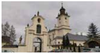
zdj. Klasztor w Imbramowicach

Gmina Trzyciąż , która w pierwszym naborze otrzymała promesy na rewitalizację trzech obiektów zabytkowych, w naborze drugim otrzyma kolejne 490 000 zł na przeprowadzenie prac konserwatorskich i restauratorskich muru klasztoru w Imbramowicach.