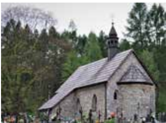
zdj. Kaplica cmentarna w Bydlinie

Również Gmina Klucze otrzyma dotację na dwa zadania: kwotę 401 400 zł na prace konserwatorskie, restauratorskie i roboty budowlane przy kościele pw. Narodzenia NMP w Cechle oraz przy kaplicy cmentarnej w Bydlinie, a także 2 399 800 zł na prace konserwatorskie, restauratorskie i roboty budowlane przy kościołach w Kluczach i Cieślinie, wpisanych do ewidencji zabytków Gminy Klucze.