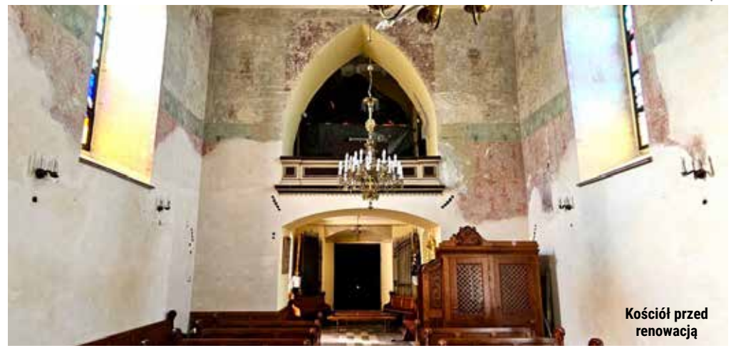
Kościół przed renowacją