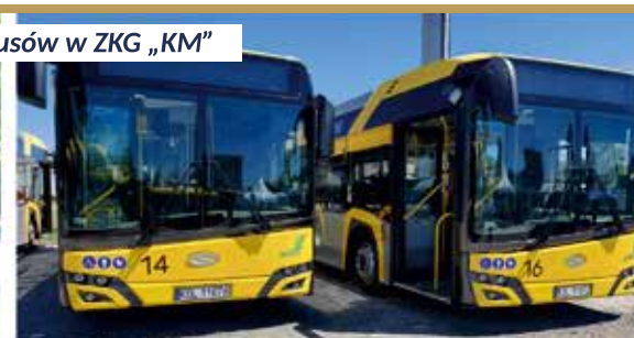
Wymiana autobusów w ZKG „KM”