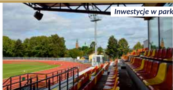
Inwestycje w parku na Czarnej Górze