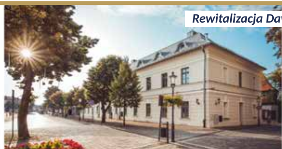
Rewitalizacja Dawnego Starostwa