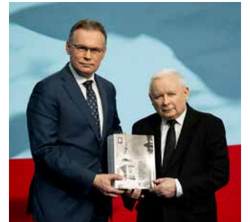
Materiał Wyborczy KW Prawo i Sprawiedliwość

Trzeba walczyć, na pewno Prawo i Sprawiedliwość nie będzie stało bacznie, ja będę zabiegać na arenie międzynarodowej o tę sprawę. Najważniejsze kogo wybierzemy w wyborach do Parlamentu Europejskiego. 9 czerwca wybierzemy europosłów, którzy będą mieć realny wpływ na postrzeganie tej sprawy przez inne kraje. Musimy wybrać takich europarlamentarzystów, którzy będą skutecznie walczyć o Polską rację stanu oraz sprawiedliwość dla Polski i Polaków.