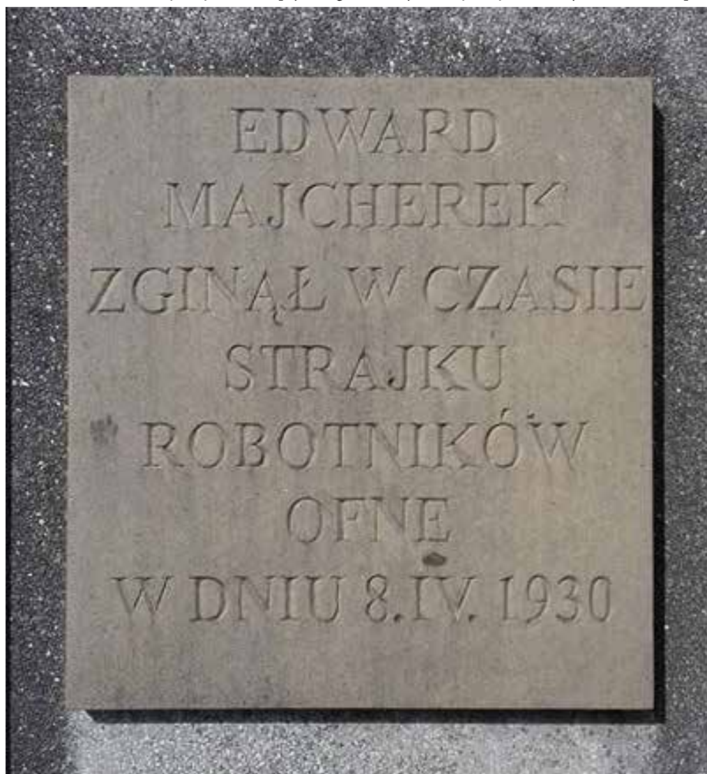
fot. Tablica pod OFNE upamiętniająca śmierć Edwarda Majcherka z błędną datą śmierci (autor_ Mateusz Radomski)