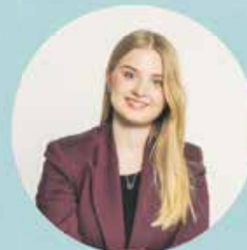
ALEKSANDRA KOT POSŁANKA NA SEJM RP