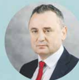
ROMAN KWAŚNIEWSKI PRZEWODNICZĄCY KOALICJI OBYWATELSKIEJ W POWIECIE OLKUSKIM