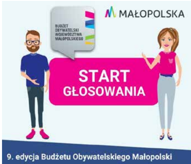
9. edycja Budżetu Obywatelskiego Małopolski

Wśród projektów związanych z ziemią olkuską znalazło się kilka propozycji, które mogą zainteresować mieszkańców regionu. W kategorii zadań regionalnych dla Krakowskiego Obszaru Metropolitalnego o głosy walczy projekt „Strzał w przyszłość – rozwijamy młode, piłkarskie marzenia” (KOM 2). Zakłada on wsparcie klubów sportowych z powiatów olkuskiego i miechowskiego, a jego wartość oszacowano na 250 tysięcy złotych. Taką samą kwotę przewidziano na projekt „Pokochaj Małopolskę – cykl wydarzeń kulturalnych i prozdrowotnych w Powiecie Olkuskim i Miechowskim” (KOM